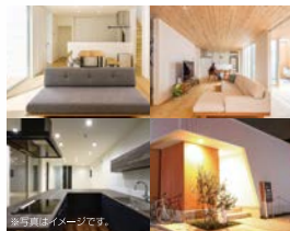
※写真はいメージです。