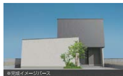
※完成イメージベース