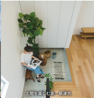
土間を楽しむ家 草津市