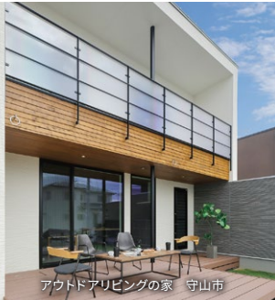
アウトドアリビングの家 守山市