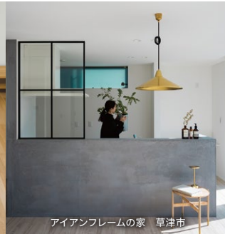
アイアンフレームの家 草津市