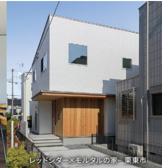
レッドンター×モルタルの家 栗東市