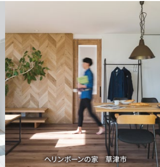
ヘリンボンの家 草津市