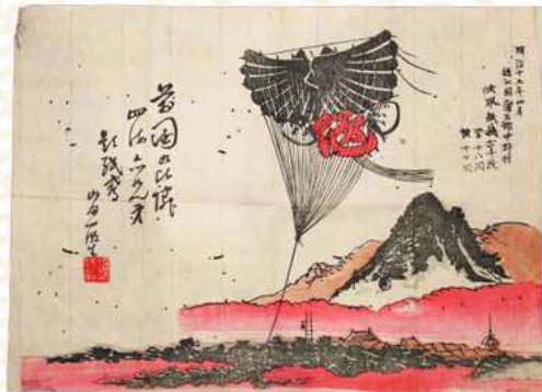
240畳敷大凧「四海兄弟」 1882年(明治15年)