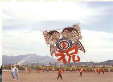
80畳敷大凧「祝ひわご国体」 1981年(昭和56年)