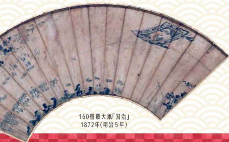
160畳敷大凧「国治」 1872年(明治5年)