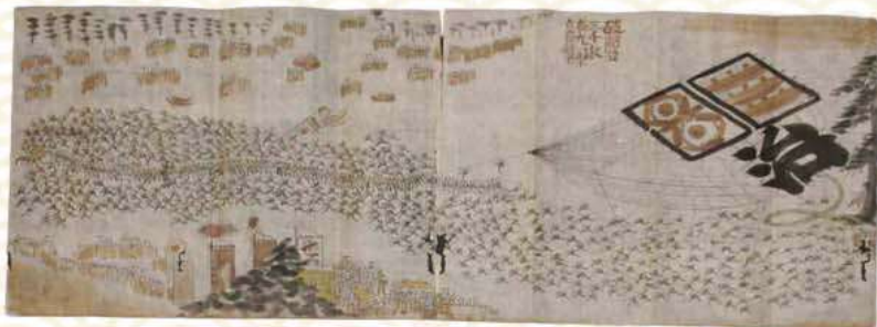
100畳敷大凧「国は治」 1848年(嘉永元年)