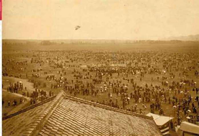
50畳敷大凧「開隊記念」 1922年(大正11年)

今回、30周年記念の年にあたり、版画及び絵や戦後に飛揚された大凧の貴重な写真資料、また、東近江大凧会館開館後の大凧の活動等の資料を展示いたします。