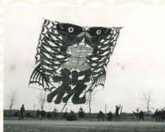
100畳敷大凧「皇太子御成婚を祝す」 1959年(昭和34年)