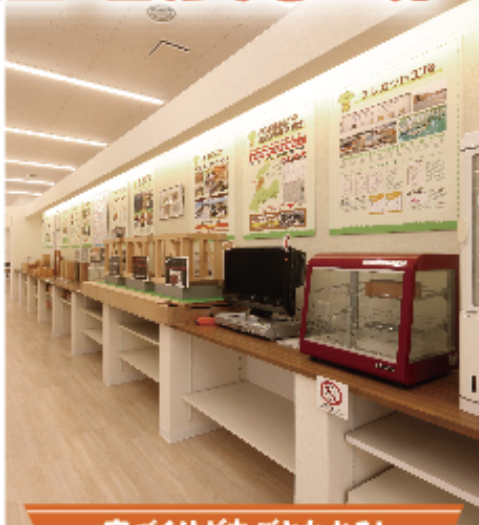
家づくりが丸ごとわかる! ショールーム