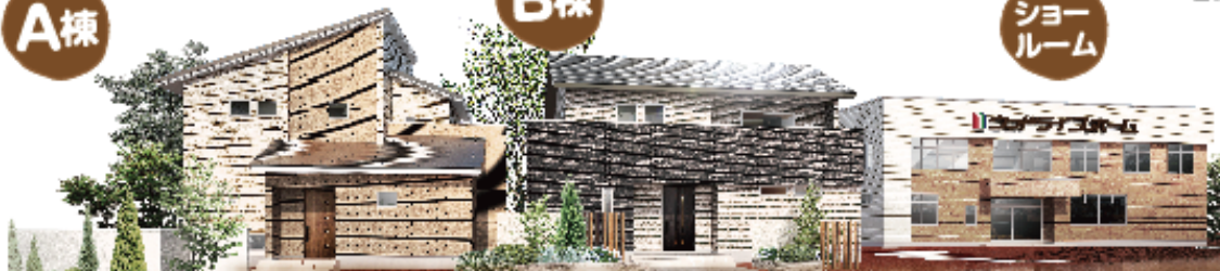
タイプが異なる2棟のモデルハウスと新体感型ショールームが併設