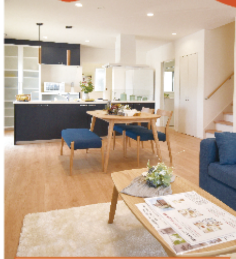
家事時短動線&片付け収納の家