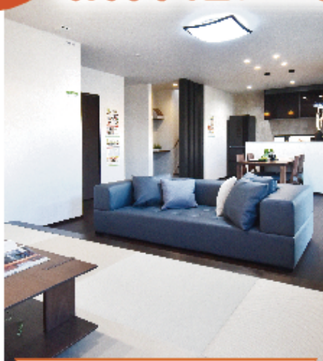
畳リビングのある大空間LDK