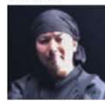
墨絵師 / 御歌頭さん