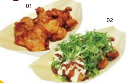
01/からあげ ¥330 02/ねぎポキマヨ ¥380