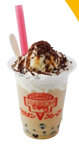
タピオカスペシャルミルクティー ¥470