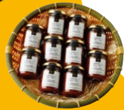
久世福の和ジャム あんバター各 ¥518