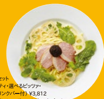
ビュッフェセット (スシ/カツ/チリ/選べるピッツァ/ サラダ/ドリンク(一付) ¥3,812 ※写真は「トリュフボールと鴨の生ハム」