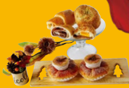
手前/モンブランクリーム シーブスト ¥194 奥左/あん塩パン ¥162 奥右/月見カレーパン ¥162