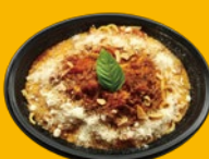
ホルターニ賞と藍色たまねぎの ミートソース ¥800