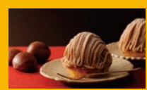
イタリア家のモンブラン ¥390(ドリンクセットなら¥600)