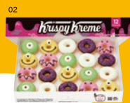
01/ハロウィンダズン(12個) ¥1,944 02/ミニボックス(20個) ¥1,944