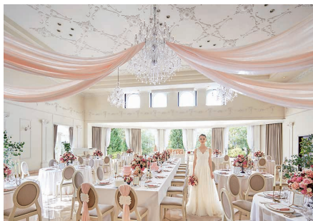
パーティーホール【116名まで収容可能】