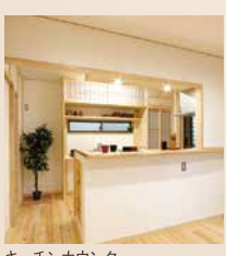
キッチンカウンター