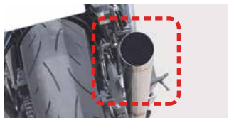
基準不適合マフラーの装着 消音器の取り外し