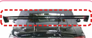
基準外ウイングの取付け